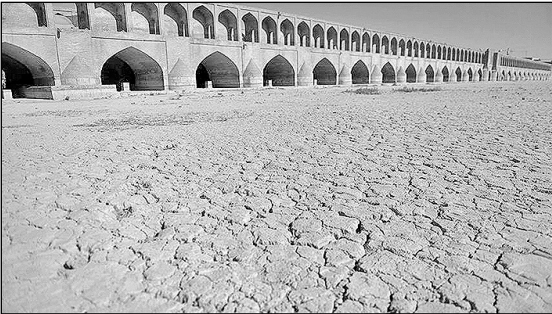
اصفهان - خبرنگار کیهان:

مدیرعامل سازمان پارک‌ها و فضای سبز شهرداری اصفهان گفت: جایگزینی گونه‌های چمن مقاوم به خشکی در دستور کار سازمان پارک‌ها قرار گرفته است.