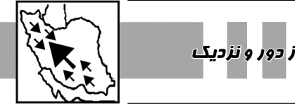
گزارش از دور و نزدیک

رئیس انجمن بیماران کلیوی کشور اظهار کرد: امروز در سرپل‌ذهاب از آن آبادانی که صحبت شده بود چیزی ندیدیم، لذا انتظار داریم مسئولین مسئولین شفاف اعلام کنند که در هشت ماه گذشته برای زلزله‌زدگان چکار کردند؟ چرا یک خانواده هشتت و یا دهنفسره باید در یک کانتکس زندگی کنند.