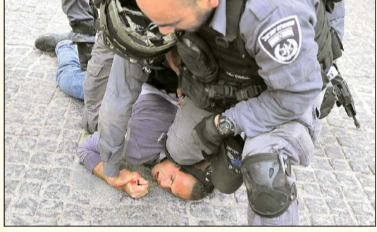
حمله وحشیانه رژیم صهیونیستی به صحن مسجد الاقصی و جوانان فلسطینی

منابع آمریکایی گزارش دادند کاخ سفید برای تبلیغ و جا انداختن معامله قرن در سطح دیپلماتیک ۱۷۵ میلیون دلار هزینه در نظر گرفته است.