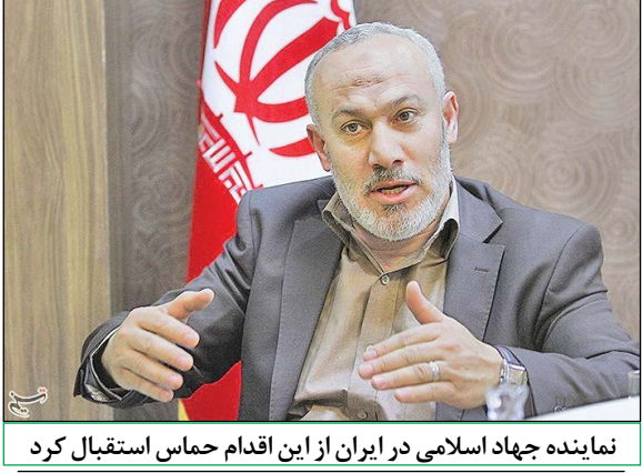
نماینده جهاد اسلامی در ایران از این اقدام استقبال کرد