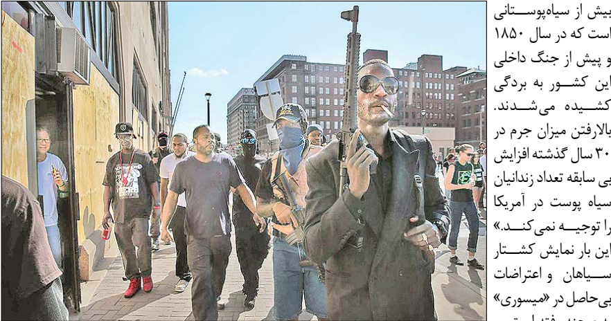
برخی مخالفان نژادپرستی، با سلاح به خیابان‌ها آمده بودند

و با نیروهای پلیس به شدت درگیر شدند. تصاویر منتشر شده از این اعتراضات نشان می‌دهد، مردم خشمگین پرچم‌های آمریکا را به آتش کشیدند و شماری از