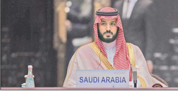
سوویس خارجی –

به دنبال آغاز بازداشت‌های اخیر در عربستان، که پس از سرکوب شیعییان عوامیه صورت می‌گیرد روزنامه نیویورک تایمز در گزارشی نوشته علت این اقدام هموار کردن مسیر برای نیویورک محمد بن سلمان به تخت پادشاهی است.