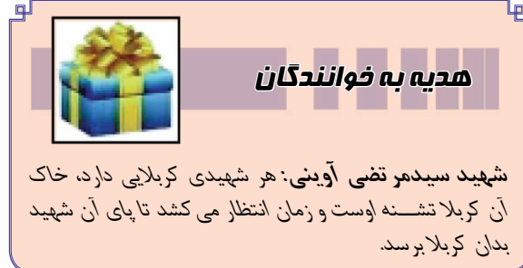
هدیه به خوانندگان

شهید سیدمر تقی آوینی: هر شهیدی کربلایی دارد، خاک آن کربلا تشنه اوست و زمان انتظار می کشد تا پای آن شهید بدان کربلا برسد.