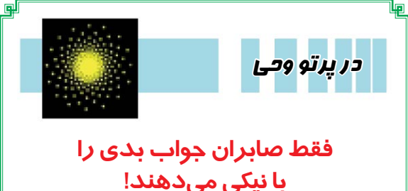
در پرتو وحی