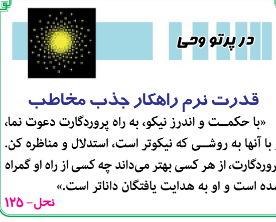
در پرتو وحی