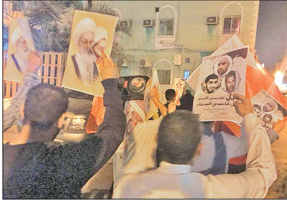
سرویس خارجی -

صدور حکم اعدام برای شش جوان بحرینی بی‌گناه آن هم در دادگاه‌های نظامی آل خلیفه، بحرین را به هم ریخته است. مردم، علما، سازمان‌ها و شخصیت های مختلف این «جنایت» را به شدت محکوم کرده‌اند.