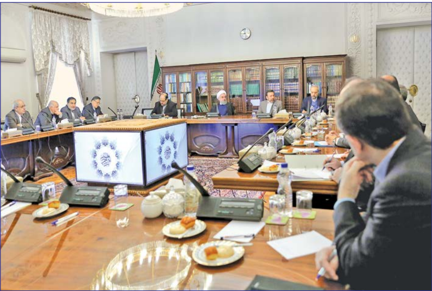
دشوار خواهد بود.

رئیس‌جمهور تصریح کرد: در صادرات یک محصول آنچه بسیار مهم است توجه ویژه به خواست مصرف‌کننده و حفظ