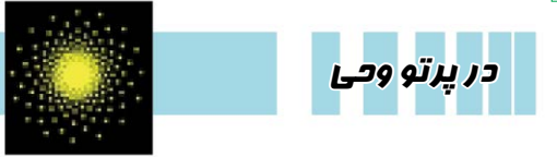
در پرتو وحی