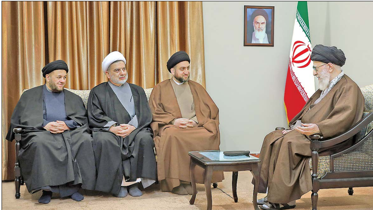
رهبر انقلاب در دیدار عمار حکیم و هیئت همراه: صفحه ۲

خبر ویژه فعلاً جلوی خسارت محض را بگیرید تکرار برجام پیشکش چرا در ماه‌های آخر دولت یازدهم بیکاری برای دولت‌مردان مهم شده است؟! صفحه ۲ یادداشت روز این خطر جدی است! صفحه ۲