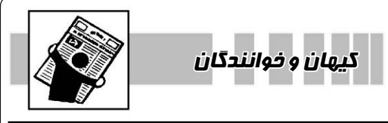
کیهان و خوانندگان

روزنامه جوان در این باره نوشت: پرحاشیه‌ترین قرارداد گازی کشور هنوز گرفتار اما و گریه‌های است که قرار بود توسط وزیر نفت ختم به خیر شود. بیژن نامدار زنگنه وقتی به شکل عجیبی به عنوان نامزد روحانی برای حضور در وزارت نفت راهی جلسه رای اعتماد شد با انتقاد تعدادی از نمایندگان مجلس روبه‌رو شد که مهم‌ترین این بحث کرسنت بود. در همان جلسه یکی از نمایندگان مجلس گفت در صورت کرسنت زنگنه به عنوان وزیر نفت ایران در داد‌گاه محکوم می‌شود. زنگنه در همان جلسه اینگونه پاسخ داد «این حرف یک جنگ روانی است که از بیرون به مجلس