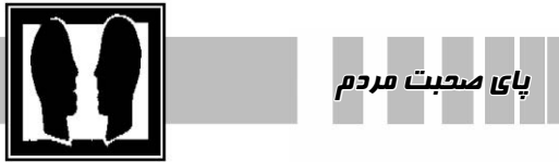
پای صحبت مردم

وی با تأکید بر تشدید نظارت بر واحدهای نانوائی تصریح کرد: در نیمه اول اسمال ۵۰ پرونده تخلفاتی برای انوائان تشکیل و به علت کم فروشی و عدم رعایت موازین بهداشتی به پرداخت ۸۶میلیون ریال جریمه محکوم شده‌اند.