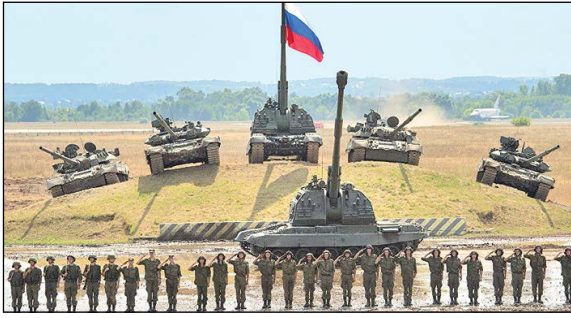
سرویس خارجی –

وزارت دفاع روسیه از آغاز «رزمایش بزرگ» این کشور در شبه‌جزیره کریمه و دریای سیاه به دنبال افزایش تنش‌ها با اوکراین در این منطقه خبر داد.