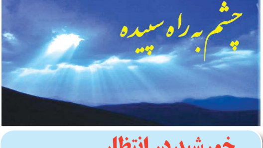
خورشید در انتظار