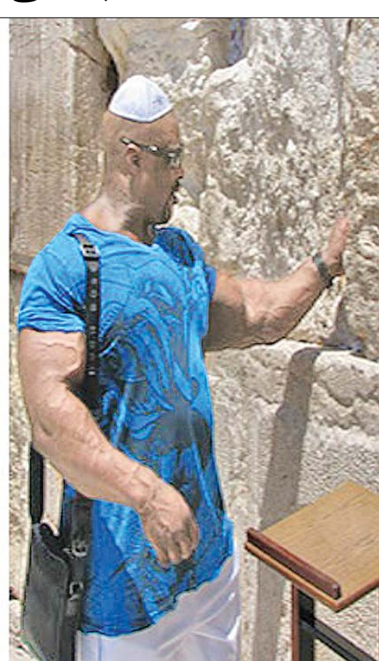
کلمن در کنار دیوار ندبه

خبر ویژه سرانجام یک سال دروغ و جنجال درباره بورسیه ها صفحه ۲