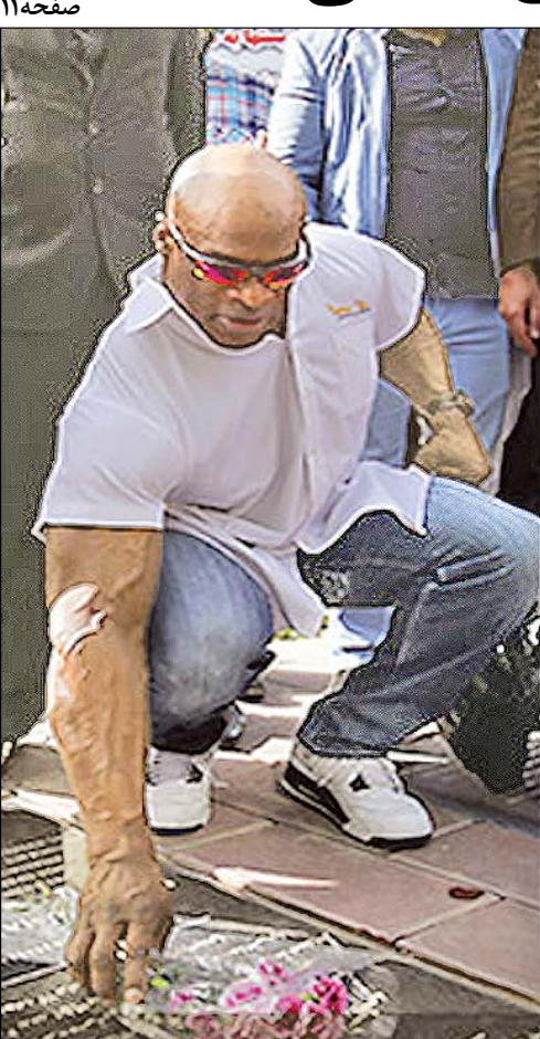
کلمن بر مزار شهدا در بهشت زهرا!