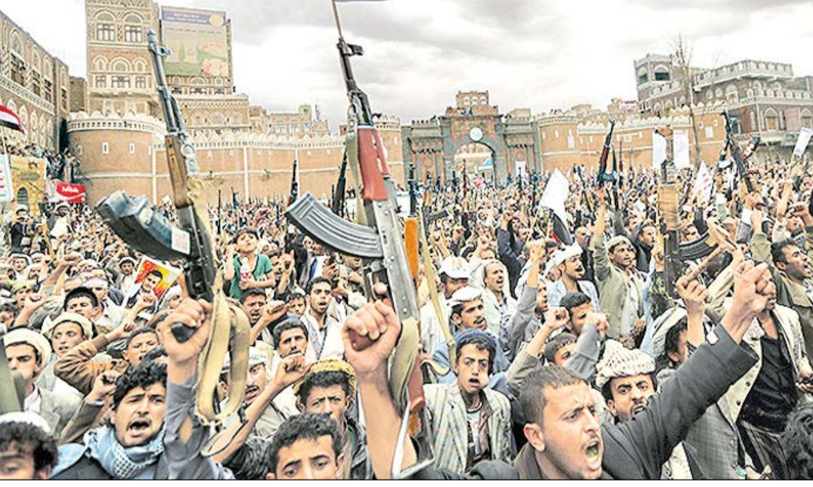
به دنبال توافق احتمالی در مذاکرات هسته‌ای دانست.

تحولات داخلی یمن را نیز می‌توان از عوامل تسریع کننده تجاوز نظامی عربستان به این کشور داست. به عبارت دیگر تجاوز نظامی به یمن واکنش وحشت زده عربستان به تحولات داخلی یمن بود. اما علت این وحشت زدگی را در جغرافیا و موقعیت استراتژیک یمن باید جست وجو کرد. تسلط مردم یمن بر سرزمش خودشان و به وجود آمدن یک نظام سیاسی مستقل در یمن می‌تواند تأثیرات ژئولیتیکی گسترده‌ای داشته باشد. اشراف یمنن بر تنگه باب المندب و بر دریای سرخ در واقع وضعیت یمن را ویژه کرده است همگرایی با شیعیان عربستان و احتمال به خطر افتادن منابع نفتی عربستان نیز می‌تواند از دلایل حمله شتابزده عربستان به یمن باشد.