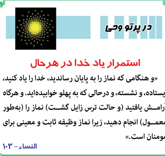
در پرتو وحی