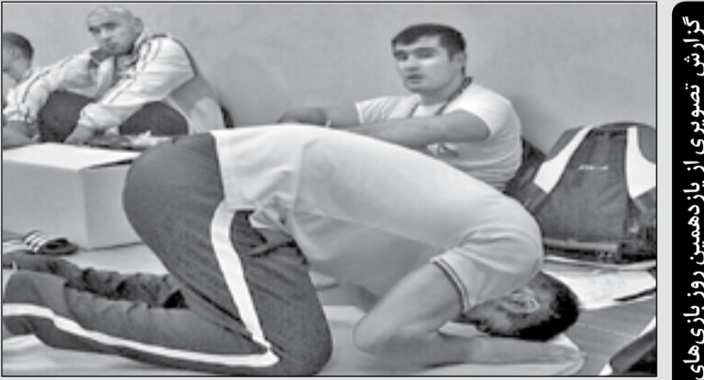
گزارش تصویری از یازدهمین روز بازی‌های آسیایی