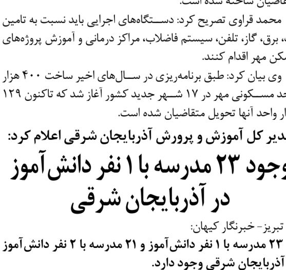
کرج- خبرنگار کمیجان:

یک هزار و ۱۰۰ واحد مسکونی مهر در شهر جدید هشتگرد به مردم استان البرز واگذار شد.