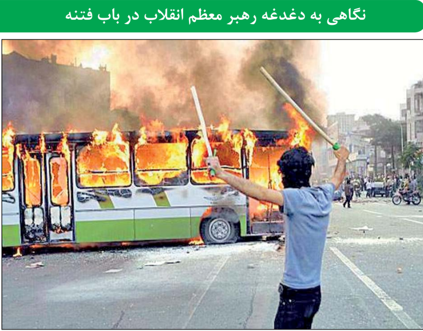
نگاهی به دغدغه رهبر معظم انقلاب در باب فتنه

فتنه گران در دوران امام راحل امروز این موضوع را از یک کارشناس تاریخ معاصر سراغ گرفته ایم و نظر ایشان را در باره برخورد امام (ره) با فتنه گران در دوران حیات و پروتکت شاون سوال کردیم. او در این باره می گوید: «اگر اندک توجهی به تاریخ معاصر کشور و روز شمار دهه اول انقلاب داشته باشیم، حوادث مشابهی مثل فتنه ۷۸