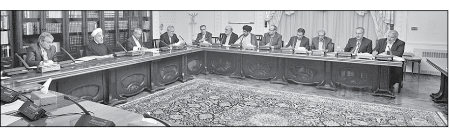
جلسه هیئت امنای صندوق توسعه ملیروز گذشته به ریاست رئیس‌جمهور و با هدف برپایی و تصویب نظام‌نامه ارزی و ریالی تسهیلات از محل منابع این صندوق برگزار شد.