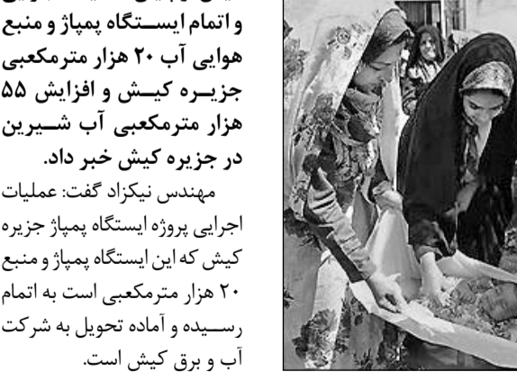
کاشان- خبرنگار کیهان:

نخستین جشنواره گل‌غلطان کودکان یک‌ساله در قالب سیزدهمین جشنواره گل و گل‌باد در تفرجگاه تپه تاریخی قلعه بزرگ شهر بزرگ از توابع شهرستان کاشان برگزار شد.