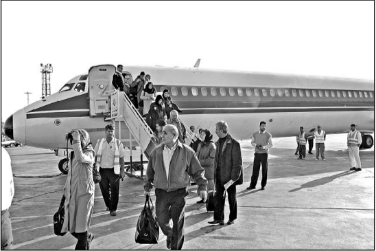
کیش- خبرنگار کیهان:

مدیران شرکت‌های خدمات مسافرت هوایی و گردشگری در جزیره کیش، تهران و مراکز استان‌های سراسر کشور خواستار فعالیت شبانه‌روزی فرودگاه بین‌المللی کیش شدند.