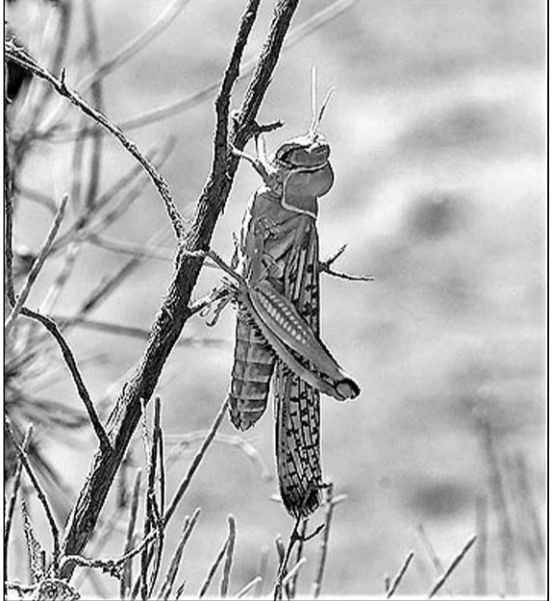
اصفهان- خبرنگار کیهان:

یک هزار هکتار از زمین‌های کشاورزی استان اصفهان مورد هجوم ملخ ها قرار گرفت.