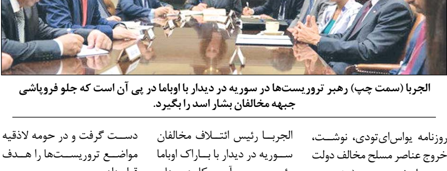
الجریا (سمت چپ) رهبر تروریست ها در سوریه در دیدار با اوباما در پی آن است که جلو فروپاشی جبهه مخالفان بشار اسد را بگیرد.

روژنامه واشنگتن پست بر مبنای تحقیقی که از اعضای گروه های تروریستی در سوریه انجام داده است نوشت، افراد مسلح به تدریج امید خود را از دست داده اند و از جنگ کردن با نظام سوریه منصرف شده اند. به نوشته این روزنامه آمریکایی، مخالفان نظام بشار اسد به این نتیجه رسیده اند که در بین مردم جایی ندارند و رسیدن به پیروزی محال است و جنگ کردن و جان باختن بی فایده است. واشنگتن پست افزود، نامیدی افراد مسلح از پیروزی در مقابل نظام سوریه و بحران مالی مهم ترین عامل جدایی این افراد از گروه های تروریستی است. این روزنامه تأکید کرد، بسیاری از عناصر مسلح به دلیل طولانی شدن جنگ غرب را سرزنش می کنند. روزنامه آمریکایی نوشت، خروج عناصر مسلح از حمص روپای سرنگونی بشار اسد را به یاس میدل کرد. به گزارش خبرگزاری تسنیم،