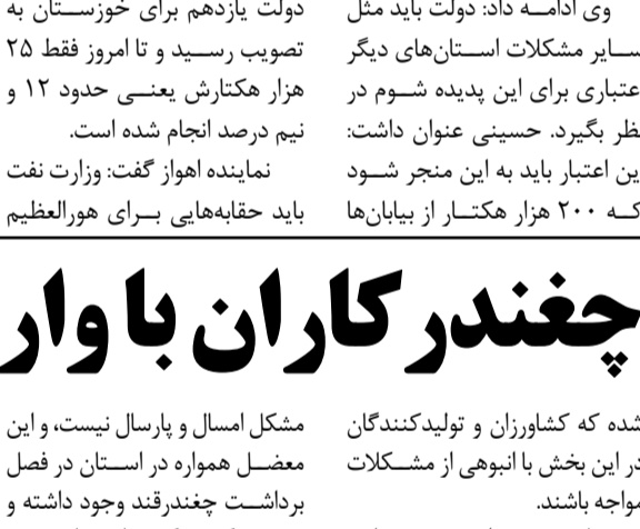
اهواز – خبرنگار کمیجان: نماینده مردم اهواز، باوی، حمیدیه و کارون در مجلس شورای اسلامی گفت: از ۱۲

«ئلمار ولی‌اوف» تاکید کرد که «راده سیاسی ایران و آذربایجان، بر توسعه و تقویت روابط دو کشور