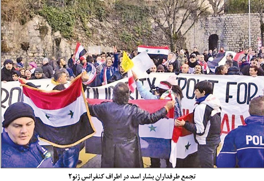
تجمع طرفداران بنشار اسد در اطراف کنفرانس ژنو۲