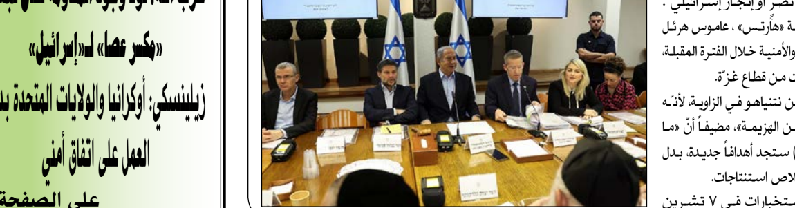
البقية على الصفحة ٧

بيروت-المباين: تناولت وسائل إعلام «إسرائيلية»، الثلاثاء، قضية استقالة رئيس شعبة الاستخبارات العسكرية (أمان)، أهارون حاليفا، على خلفية فضله في كشف عملية «طوفان الأقصى» في ٧ تشرين الأول/أكتوبر ٢٠٢٣. وقال حاليفا في نص الاستقالة الذي قدمه لرئيس الأركان هرتسي هاليفي إن «شعبة الاستخبارات لم تقم بالمهمة التي أوتمنت عليها». وقال الإعلام إن «الشرح الداخلي الذي بدأ يتسع مع وصول المعركة في قطاع غزة إلى ما بات جمع كبير من محلي الاحتلال وقادته الأمنيين والسياسيين يرون أنه طريق مسدود لتحقيق أي نصر أو إنجاز إسرائيلي». من ناحيته، توقع محلل الشؤون العسكرية في صحيفة «هآرتس»، عاموس هرثل موجة كبيرة من الاستقالات في صفوف القيادة السياسية والأمنية خلال الفترة المقبلة، وذلك بسبب الفضل في صد عملية ٧ أكتوبر التي انطلقت من قطاع غزة. وأشار هرثل إلى أن «هذه الاستقالات تحشر بنيامين نتانياهو في الزاوية، لأنه الوحيد الذي يرفض حتى الآن تحمل أي مسؤولية عن الهزيمة»، مضيفاً أن «ما سيحدث من الآن فصاعداً هو أن آتة الدعائية (نتانياهو) ستجد أهدافاً جديدة، بدل حاليفا، من أجل تحويل النيران إليها والمطالبة باستخلاص استنتاجات. كذلك، لفت هرثل إلى أن فشل مجتمع الاستخبارات في ٧ تشرين