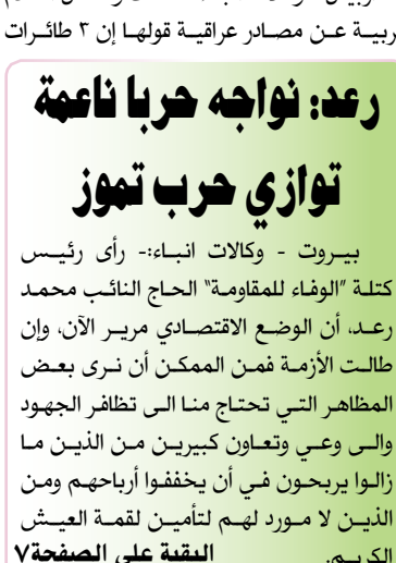
بقيت على الصفحة ٧

اربييل - وكالات انباء:- نقلت وسائل اعلام عربية عن مصادر عراقية قولها إن ٣ طائرات عربية رعد: نواجه حربا ناعمة توازي حرب تموز بيروت - وكالات انباء:- رأى رئيس كتلة «الوفاء للمقاومة» الحاج النائب محمد رعد، أن الوضع الاقتصادي مرير الآن، وإن طالت الأزمة فمن الممكن أن نرى بعض المظاهر التي تحتاج منا الى تظافر الجهود والى وعي وتعاون كبيرين من الذين ما زالوا يربحون في أن يخففوا أرباحهم ومن الذين لا مورد لهم لتأمين لقمة العيش الكريم. البقية على الصفحة ٧