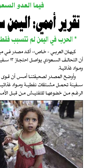
فيما العدو السعودي يواصل احتجاز ١٣ سفينة تحمل مشتقات وأغذية..

طهران - كبهان العربي:- رفض مساعد وزير الخارجية للشؤون السياسية الدكتور عباس عراقجي، خطة اليابان بإرسال قوات الى الشرق الاوسط لحماية سفنها التجارية. وقال الدكتور عراقجي في حديثه لقناة «ان.اتش.كي» الياباني بثت أمس الأربعاء، إن طهران تنتظر قرارا نهائيا من جانب اليابان، لكنها لا تعتقد أن أي وجود للقوات الأجنبية في المنطقة سيسهم في الاستقرار أو الأمن أو السلام بالمنطقة. وأشار مساعد وزير الخارجية الى أنه خلال اجتماعه مع رئيس الوزراء الياباني «أبي شينزو»، نقل موقف إيران بهذا الشأن. البقية على الصفحة ٧