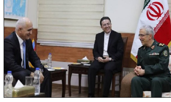
طهران - كبهان العربي:- أكد رئيس الاركان العامة للقوات المسلحة اللواء محمد باقري، بان بعض الابعين الاقليميين والدوليين لا يطبقون وجود علاقات ودية بين الجمهورية الاسلامية في إيران وجمهورية آذربيجان. وقال اللواء باقري خلال استقباله أمس الأربعاء مساعد رئيس وزراء جمهورية آذربيجان «شاهين مصطفى أوف»، حيث جرى البحث في مجالات التطوير والتنمية الشاملة للتعاون الأمني والدفاعي وضرورة تعميقه وترسيخه برؤية استراتيجية.

من جانبه وصف مساعد رئيس وزراء جمهورية آذربيجان الزيارة الاخيرة التي قام بها اللواء باقري الى باكو منعطفا في العلاقات الثنائية. وأشاد «مصطفى أوف» بمواقف ورؤى رئيس الاركان العامة لقواتنا المسلحة واعتبرها بانها من شأنها ان تؤدي الى ترسيخ العلاقات الاخوية بين البلدين الجارين الذين يربطهما تاريخ وثقافة مشتركة. البقية على الصفحة ٧