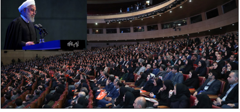
ولعهنا «راعون» وفق تصريح القرآن الكريم. وأكد رئيس الجمهورية، باننا لن نوقع

* متى ما رفعت اميركا الحظر الارهابي الظالم عن شعبنا فبالامكان ان يلتقي الرؤساء ونحن لا مشكلة لنا بهذا الصدد * على جميع طلبة الجامعات وأساتذتهم رفع شعار مكافحة الارهاب الاقتصادي والارهابيين الاقتصاديين