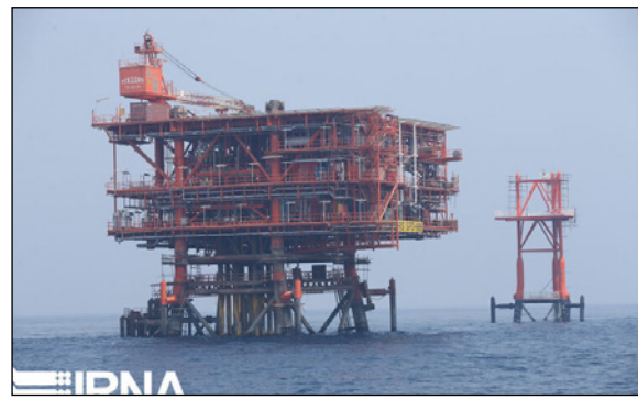
تصدير المنتجات غير النفطية والبتروكيماويات والسوائل الغازية في البلاد.

تهران-ارنا:- أعلن منفذ مشروع تطوير المرحلة ١٣ من حقل بارس الجنوبي 'بيام معتمد' في محافظة بوشهر) عن نصب منصة الغاز الثالثة للمرحلة ١٣ من حقل بارس الجنوبي في الخليج الفارسي بطاقة استخراج ١,٤ مليون متر مكعب يوميا.