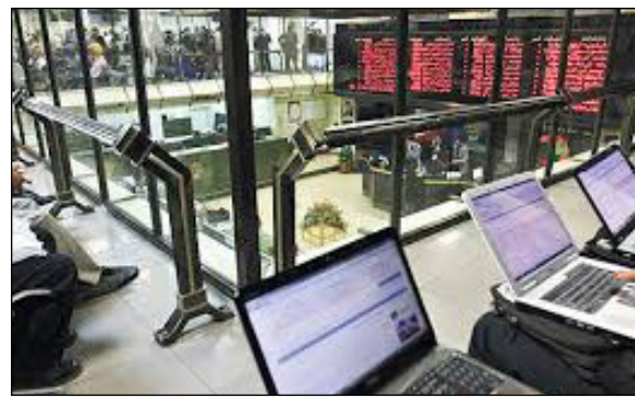
وعصد المؤشر العام بقيادة مكاسب اسهم شركات الصلب 'خوزستان' و'مباركة اصفهان' و'خراسانط بجانب 'جادارلمو' وكل كهر' للمعانب. كما صعد مؤشر السوق الموازي نحو ٩٠ نقطة الى مستوى ٦٥٥٢ نقطة.