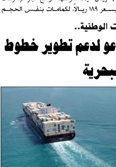
خطوط ملاحية إيرانية منتظمة على امتداد بحر الخزر، وفي الخليج الفارسي، وبحر عمان، والمحيط الهندي، وشرق افريقيا.

كما أعلن عن زيادة شحن المنتجات التصديرية عبر "خط خزر الملاحى" في بحر خزر بـ١٣ ضعفاً وأضاف، ان شحن المنتجات التصديرية ازاد من ١١ ألف طن في العام ٢٠١٥ ليصل الى ١٤٥ الف طن في العام ٢٠١٨، مما يعكس السياسة الصائبة في دعم انشاء واستمرار عمل خطوط الملاحة البحرية المنتظمة.