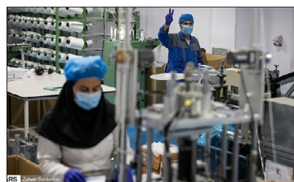
مختبر في إيران لإنتاج المعقّمات الطبية.

طهران - فارس :- أعلن وزير التجارة والصناعة رضا رحمانى عن تضاعف حجم إنتاج المعقّمات الطبية والمنتجات الصحية منذ ٢٠ فبراير/شباط ٢٠٢٠.