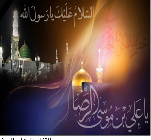
التفاصيل على الصفحة ٧

في ذكرى استشهاد الرسول الأكرم وحفيده الرضا.. مساوي الطلقاء واليهود في إغتيال نبي الرحمة وحرف رسالته