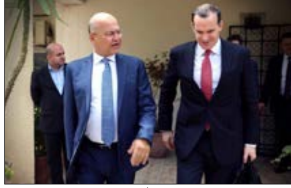
الخارجية الأمريكية جون سوليفان، إلى جانب السفير الأمريكي في العراق دوغلاس سليمان. وشهد رئيس الجمهورية، خلال اللقاء على