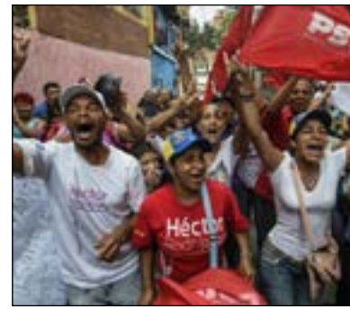
كاراكاس- وكالات انباء:- أعلن المجلس الوطني للانتخابات في فنزويلا امس الاثنين أن حزب الرئيس نيكولاس مادورو فاز بـ١٧ ولاية من أصل ٢٣ في الاقتراع الذي جرى الأحد. فيما رفضت المعارضة النتائج منددة بوقوع عمليات تزوير. وفاز معسكر الرئيس الفنزويلي نيكولاس

لكن خصوم الرئيس الفنزويلي ندوا بحصول عمليات تزوير محتملة. ودعا تحالف المعارضة «طاولة الوحدة الديمقراطية» السبت مادورو إلى طرد «مستشارين من نيكاراغوا» على الفور، مؤكدا أنه تم استقدامهم إلى فنزويلا لتزوير الانتخابات.