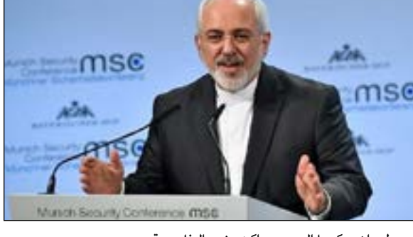
التفاصيل على الصفحة ٧

كيان العدو الصهيوني «بنيامين نتانياهو» والتي هدد فيها إيران وحمل فيها قطعة قال انها لطائرة إيرانية دون طيار بانها "سيرك هزلي". وقال الدكتور ظريف خلال مؤتمر حول الأمن في ميونخ، لقد تسنى لكم مشاهدة سيرك هزلي هذا الصباح لا يستحق حتى الرد عليه. مضيفاً: أن مشكلة الكيان الصهيوني هي السياسة العدائية تجاه جيرانه فهو يتدخل يومياً في سوريا ولبنان مشيراً إلى أن فكرة أن «إسرائيل» التي لا تقهر «تداعت».