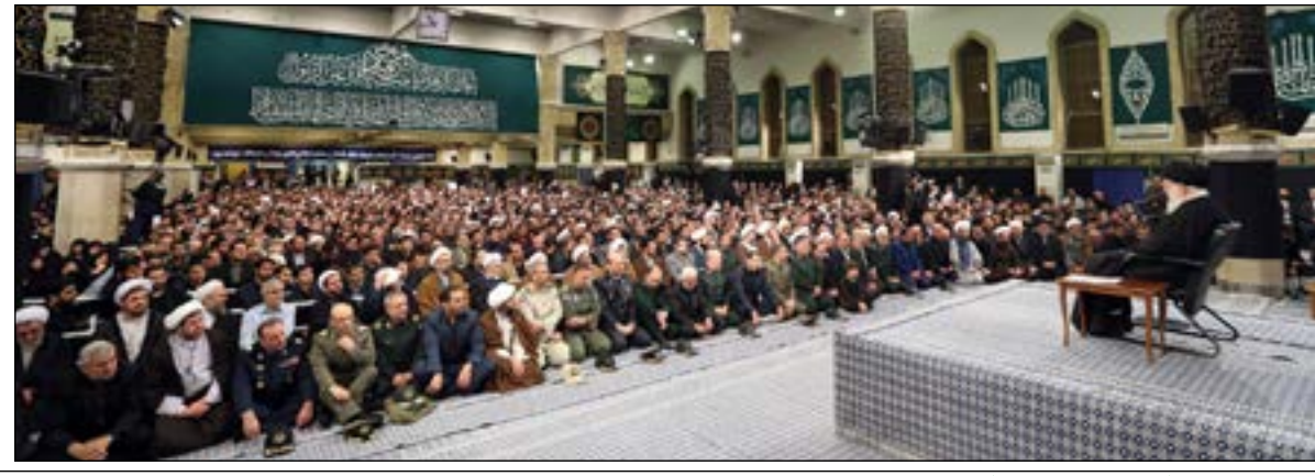
التفاصيل على الصفحة ٧

* منذ ٤٠ عاماً راية الثورة الاسلامية الخفاقة والعالية ملاذاً للناس رغم ان الشعب لديه انتقادات لبعض القضايا الجارية في البلاد * هناك وعي ونمو ثوري يتكامل لدى شعبنا وهو يميز بين النظام الثوري والقيادة، وبين النظام الاداري والحكومة * انتقادات الشعب ليست فقط من الحكومة والبرلمان والقضاء ويمكن ان تشملني ايضا لكن ذلك لا ينفي تمسكه بنظامه الاسلامي * من نتائج السيادة الشعبية ازدهار المواهب واحياء روح الثقة بالنفس لدى الشعب ما يحقق تطوراً وازدهاراً في مجالات عدة * نعتبر قضايا مثل القنبلة النووية واسلحة الدمار الشامل الاخرى حراماً شرعاً لكننا نتابع بقوة اي شيء آخر نكون في حاجة له