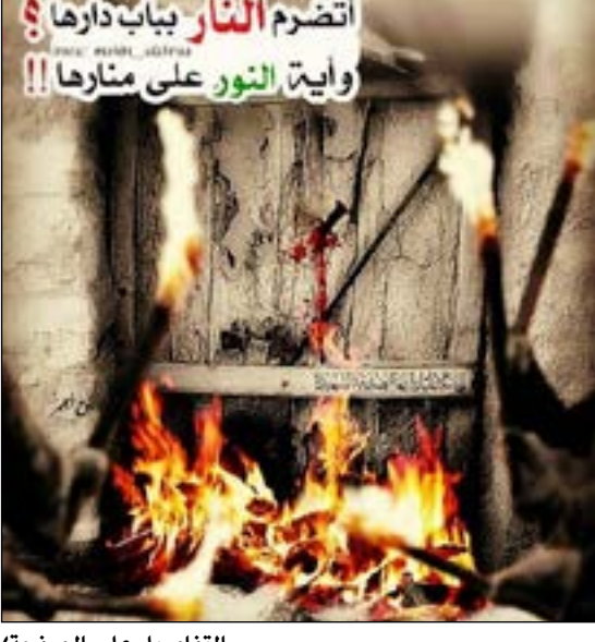
التفاصيل على الصفحة ٧

في ذكرى استشهاد المغصوبة حقها أم أبيها.. فاطمة طالبت بحقيقة فدك وليس بأرضها فلم يتحملوها