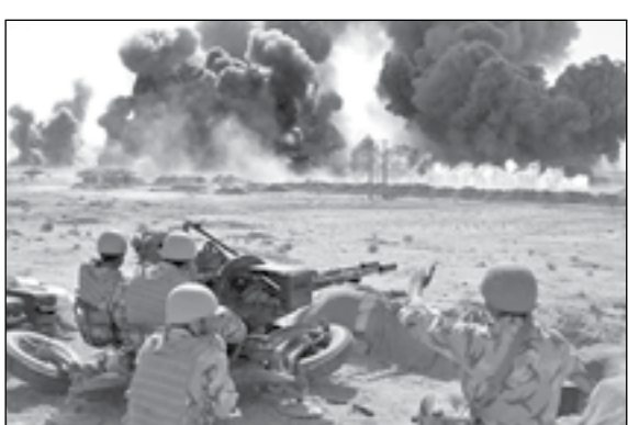
برصد المنطقة تماما وهو جاهز للتصدي لتسلسل العدو. وكان مساعد شؤون التنسيق للجيش

الادميرال حبيب الله سياري قد أعلن انطلاق المناورات «محمد رسول الله (ص)» المشتركة الخامسة للجيش في جنوب وجنوب شرق البلاد وتجرى هذه المناورات المشتركة على مساحة ٢ ملايين كيلومتر مربع في جنوب وجنوب شرق البلاد وسواحل مكران وبحر عمان حتى مدار ١٥ درجة شمال بمشاركة واسعة من القوات البحرية والبرية والجوية ومقر «خاتم الانبياء (ص)» للدفاع الجوي. وتهدف المناورات المشتركة لتعزيز المهارات والجهوية الدفاعية وكذلك الارتقاء بالروح القتالية للكوادر ونقل الخبرات وتقييم التدريبات السنوية وكذلك تمرين التنسيق بين القوات التابعة للجيش.