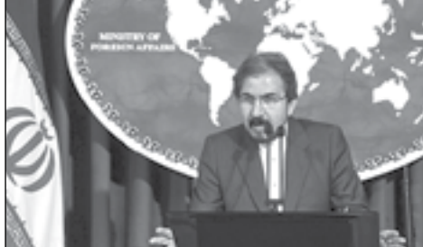
استانا مواصلة مساعينا البناءة كما في السابق مشيراً الى ان استمرار هذا الوضع بإمكانه ان يقود الى عودة الازهاب والتطرف في سوريا من جديد الامر الذي لاخدم سوريا وكذلك سائر دول الجوار واعتبر ان من الضروري احترام