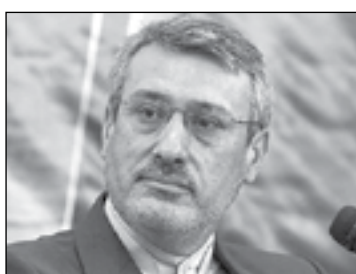
طهران-فارس:-اعتبرسفيرنا في لندن حميد بعيدي نجاد بأن الحفاظ على طبيعة مفاعل اراك لانتاج الماء الثقيل وتحديثه من اهم ثمار وانجازات الاتفاق النووي .

واوضح ان ايران عارضت هذا الموضوع واعلنت انها لن ترسل اي جزء من اجهزتها النووية الى الخارج كما رفضت اقتراح تغليف قلب المفاعل بصفايح من الصلب بعد استبداله. وافاد بيان ايران اعلنت انها تريد الاحتفاظ بقلب مفاعل اراك باعتباره نتاج ابداع العلماء النوويين الايرانيين في المتحف للاجيال القادمة وفي النهاية تم الاتفاق على مقترح غلق مفاعل قلب المفاعل وليس القلب نفسه بالاسمنت للحؤول دون الاستفادة الفورية منه .