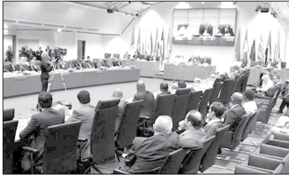
منتجين للنفط في المنطقة.

وترى الصحيفة أن ذلك يسلط الضوء على التوتر المطرد بين أكبر